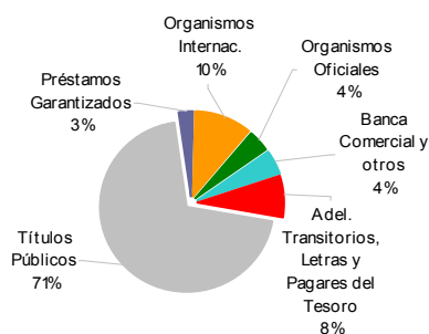
Deuda Total por Instrumento U$S 156.691 millones